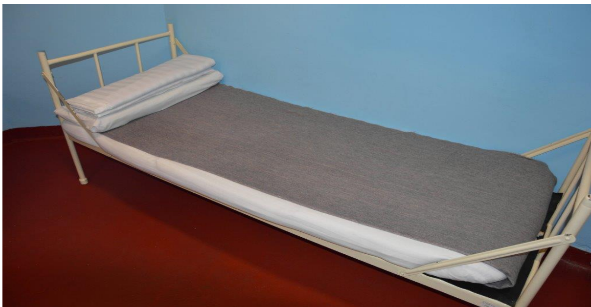
Obrázek č. 1 Vzor ustlaného lůžka

(8) Odsouzený nepoškozuje zařízení ubytovacích a využívaných prostor, neprovádí v nich jakékoliv úpravy bez souhlasu vychovatele, nenavštěvuje odsouzené ubytované v jiných oddílech nebo odděleních bez předchozího souhlasu vychovatele.