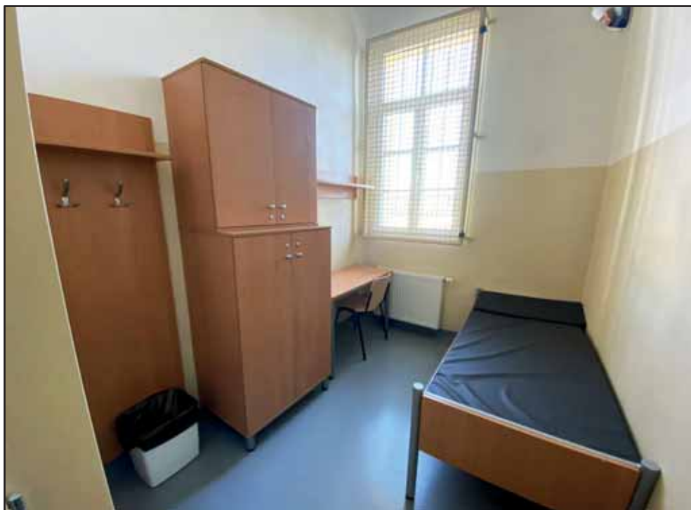
Cela pro výkon zabezpečovací detence ve Vazební věznici Praha Pankrác