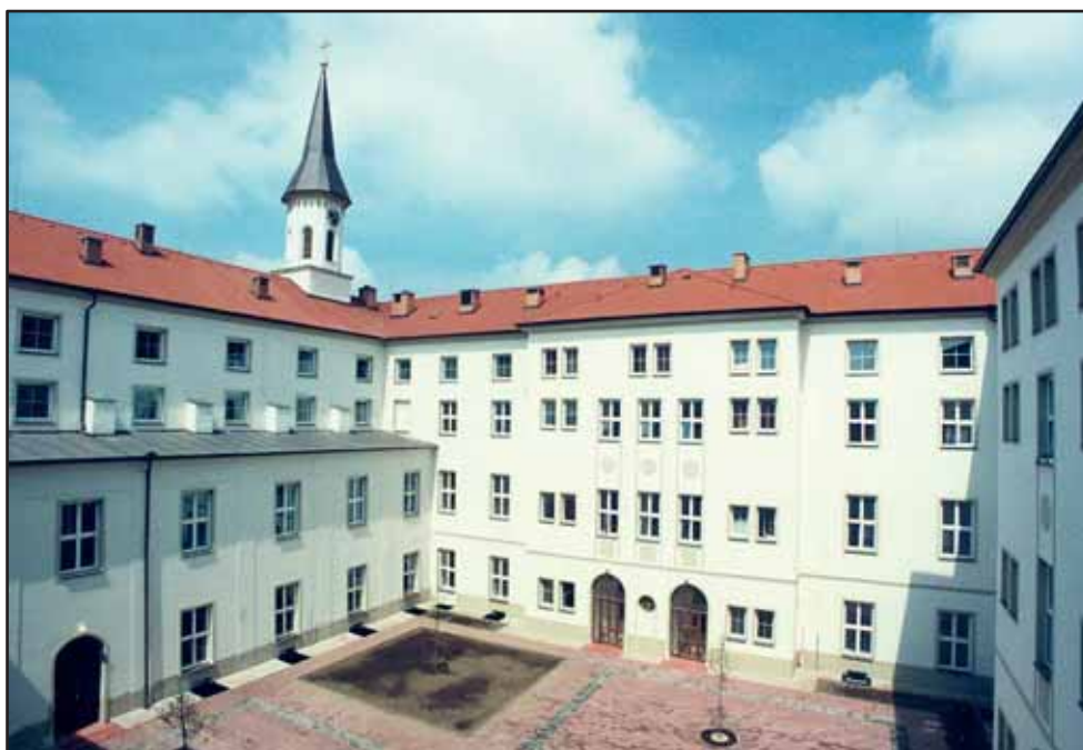
Domov sv. Karla Boromejského v Řepích

a pietní částí. Další pietní místo bylo zřízeno na bývalém popravišti z 50. let minulého století. V letech 1998 až 2000 byl vybudován ve Stráži pod Ralskem nový školský areál Institutu vzdělávání VS ČR a rozhodnutím ministra spravedlnosti se zároveň stal sídlem Justiční akademie. Vydáním zákona č. 436/2003 Sb., o ozbrojených bezpečnostních sborech se stala Vězeňská služba ČR opět ozbrojeným sborem.