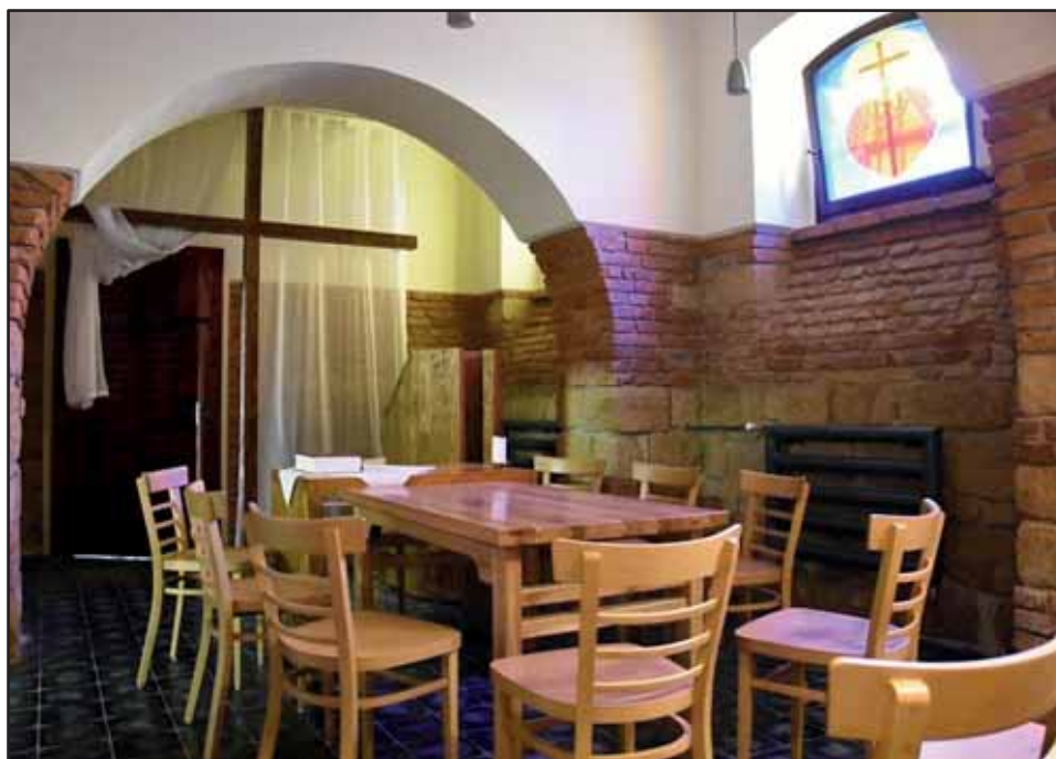
Kaple ve Věznici Plzeň