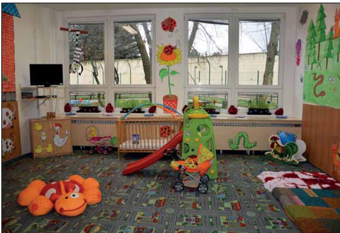
Kulturní místnost oddělení pro matky s dětmi ve Věznici Světlá nad Sázavou