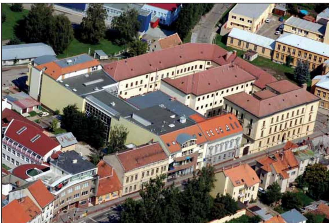
Věznice Břeclav