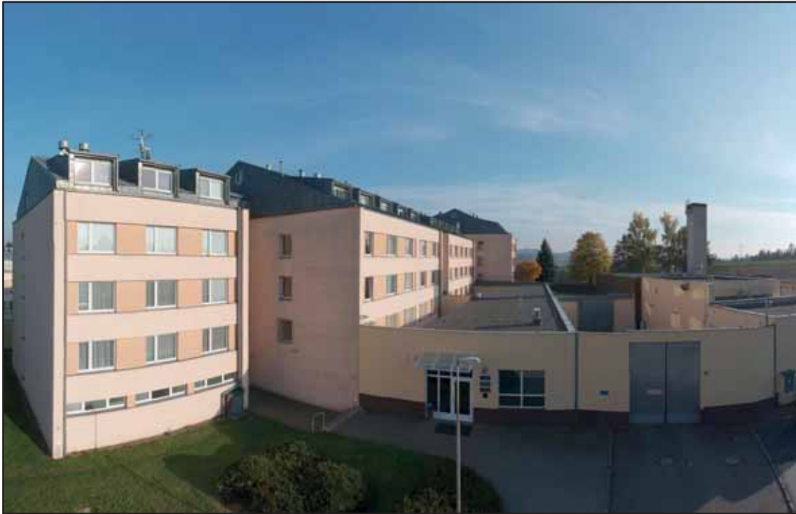
Věznice Světlá nad Sázavou