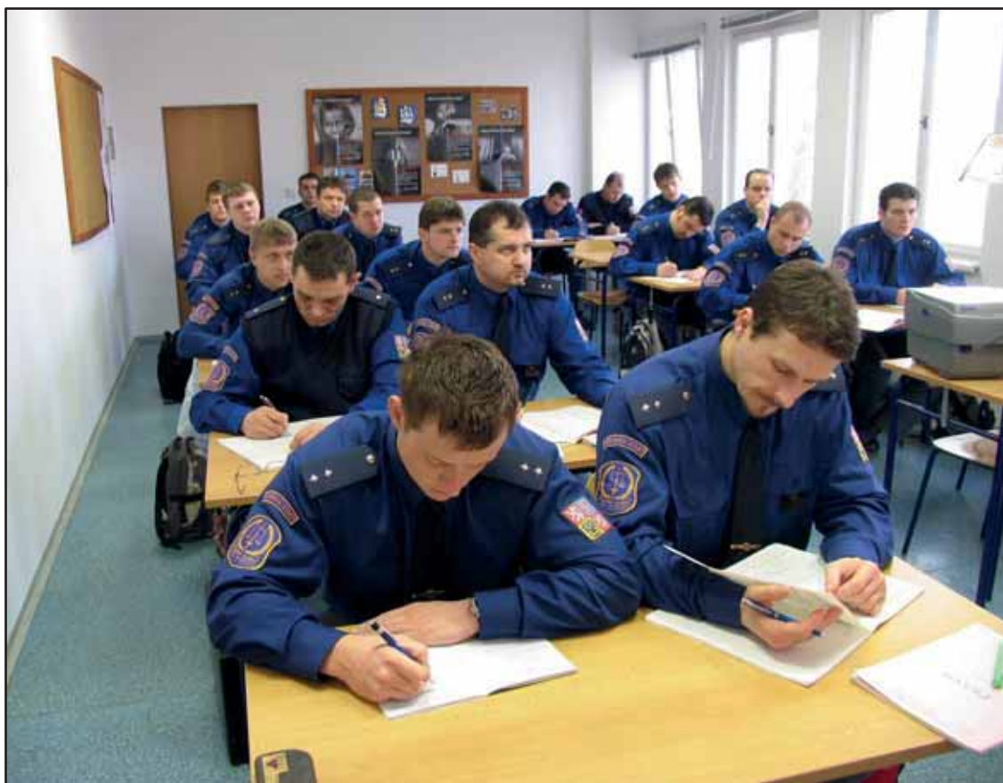
Výuka posluchačů ZOP A v AVS ČR

programu celoživotního vzdělávání se zřetelem na realizaci nižších i vyšších forem vzdělávání. V roce 2013 byl IV VS povýšen na Akademii VS (AVS) ČR. Došlo k rozvoji vzdělávání a výzkumu penitenciární problematiky adiktologie. Byly pořádány víceúrovňové specializační kurzy, zejména pro odborné pracovníky VS se styku s vězňenými uživateli drog a drogově závislími. Díky příznivým podmínkám pro činnost Kabinetu dokumentace a historie VS ČR byla v roce 2014 otevřena pod Pražským hradem výstava o historickém vývoji českého vězeňství a o rok později výstava o podílu Milosrdných sester sv. Karla Boromejského na nápravě odsouzených žen v Řepích. Úspěšná činnost Akademie VS byla potvrzena při návštěvě prezidenta republiky Miloše Zemana v roce 2015.