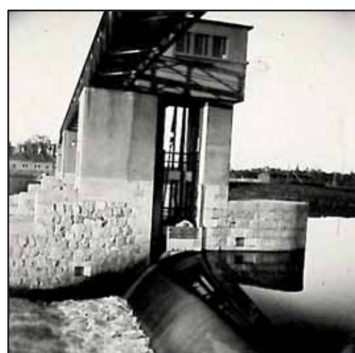
Fotografie vyfocené B. Lustigovou v roce 1946, které byly později zabaveny u L. Dropuljiče a sloužili jako důkaz jeho špionážní činnosti – nádraží, most a přístav v Děčíně, zdymadlo v Kostomlatech nad Labem