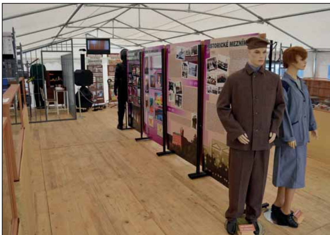
Expozice KDH na Dnech NATO v roce 2012

s fotodokumentací byly atraktivní trojrozměrné exponáty vězeňské a služební výstroje, donucovacích prostředků, zbraní, eskortních a sanitních automobilů a také výrobků, uměleckých výtvorů a nepovolených předmětů odsouzených. Významné místo má prezentace Střediska hospodářské činnosti Vazební věznice Praha Pankrác, která zaměstnává odsouzené a nabízí produkty nábytkové výroby, kovovýroby a poskytuje prádelenské a tiskařské služby. Byly představeny také nové projekty zaměstnávání odsouzených, zejména zavádění včelařství. V průběhu dynamické prezentace byly předváděny ukázky z činnosti zásahových jednotek VS při útěku vězně, eskortování nebezpečného vězně a napadení eskorty.