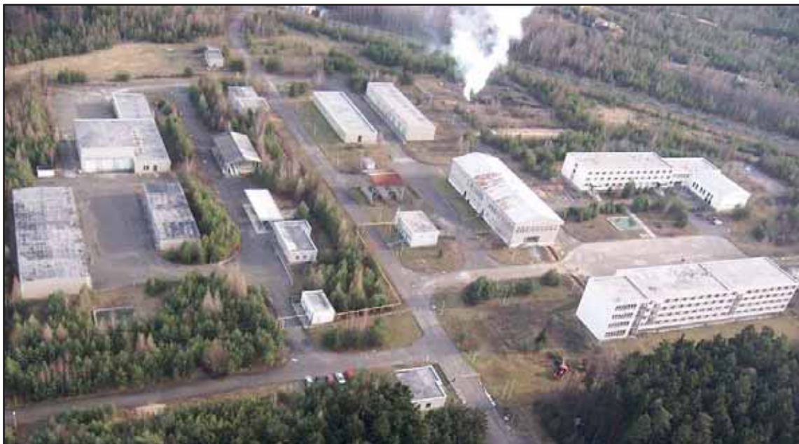
Věznice Rapotice