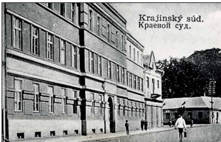
Krajský soud v Chustu