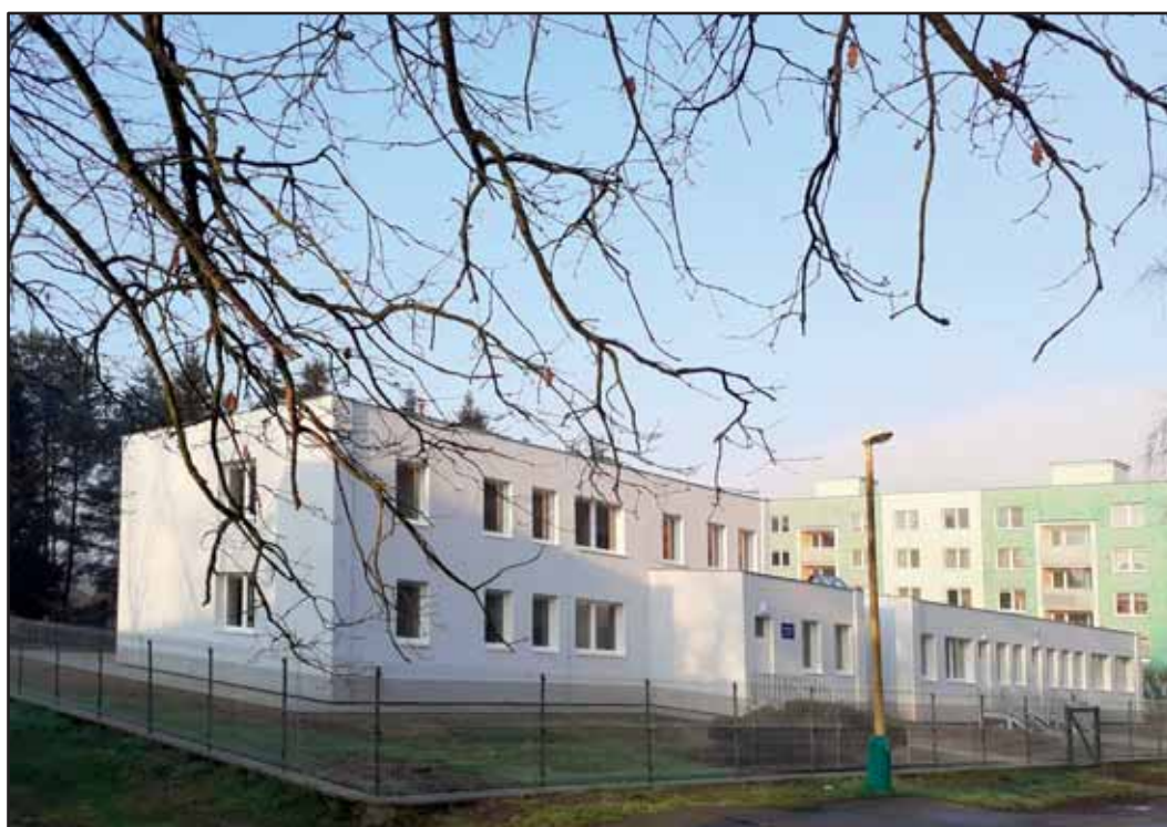
Výcvikové a vzdělávací centrum Akademie VS ve Stráži pod Ralskem