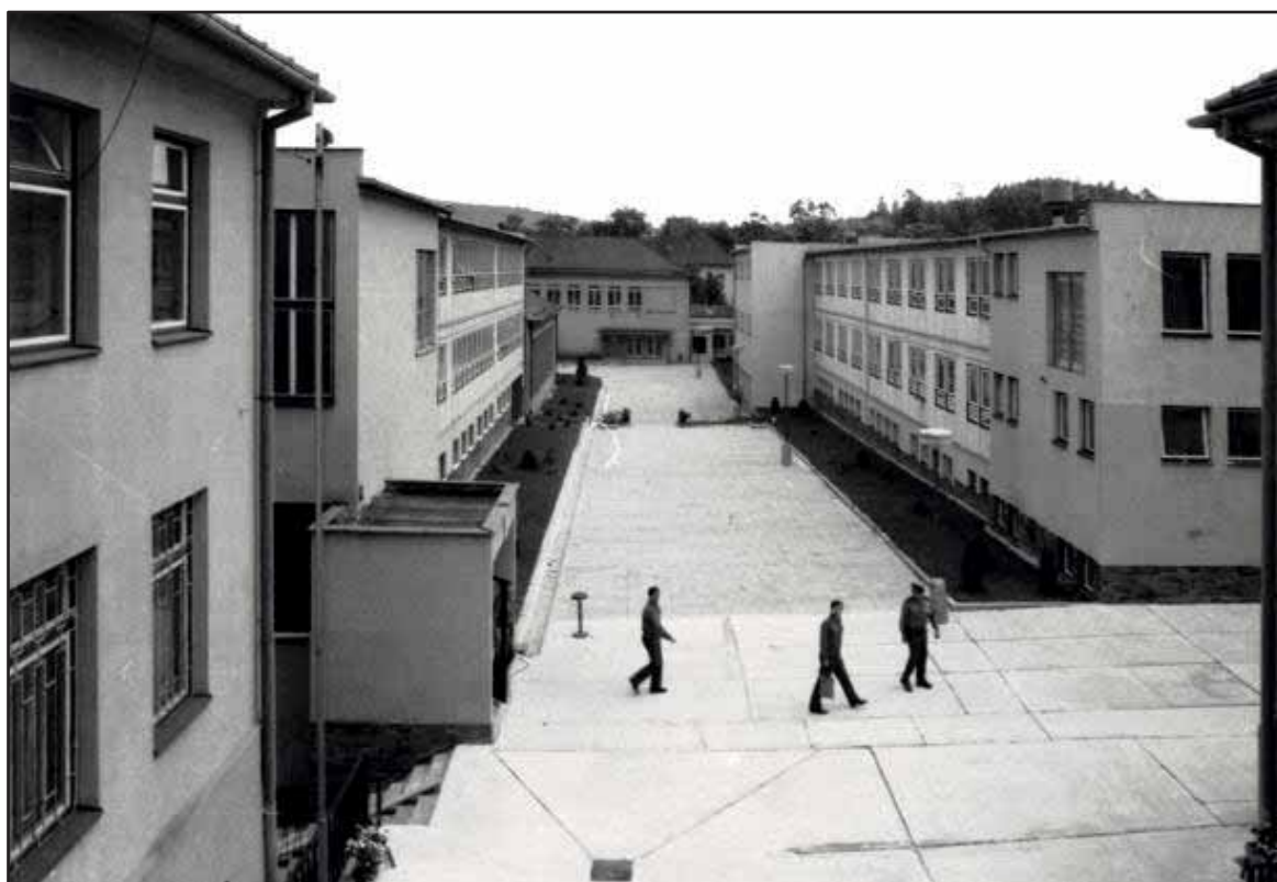
PŠ SNB v Zastávce u Brna

Po převodu vězeňství z ministerstva vnitra do působnosti ministerstva spravedlnosti 1. ledna 1969 byly postupně vytvářeny organizační, personální a materiální podmínky pro odbornou přípravu vězeňského personálu. Při pobočce Praporčické školy Sboru národní bezpečnosti (PŠ SNB) se sídlem v Ostrově nad Ohří byla zřízena katedra Sboru nápravné výchovy (SNV), která organizovala a zajišťovala odborné vzdělávání a výcvik příslušníků SNV.