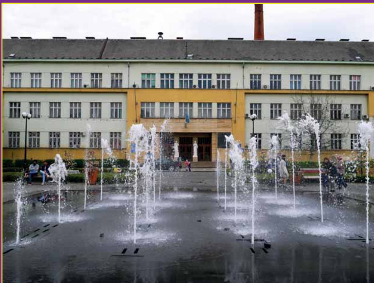
Průčelí bývalého krajského soudu v Užhorodu