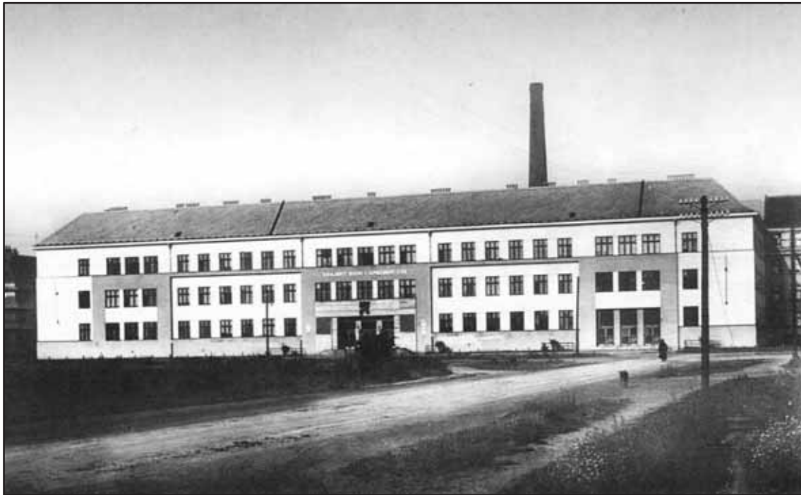
Krajský soud v Užhorodu postavený v letech 1924-1928

Podkarpatské Rusi počal shánět po zimních přikrývkách pro věznice a na podzim i po dalším vybavení (šálky, slavníky), které se na Podkarpatské Rusi dalo opatřit jen za vysoké ceny, ale které se mohlo vyrábět ve věznicích v historických zemích, což byla též pravda, neboť šálky a boty (včetně obnošených a vojenských) bylo možné objednat v Trestnici pro muže v Praze a slavníky v Trestnici pro ženy v Řepích. Zmíněné obnošené boty chtěla berehovská věznice přidělovat vězněným cikánům, u kterých se očekávalo, že by nové boty ihned zničili, a nový materiál chtěla správa věznice uchovat pro vězně pracující na polích a vůbec venku. 13