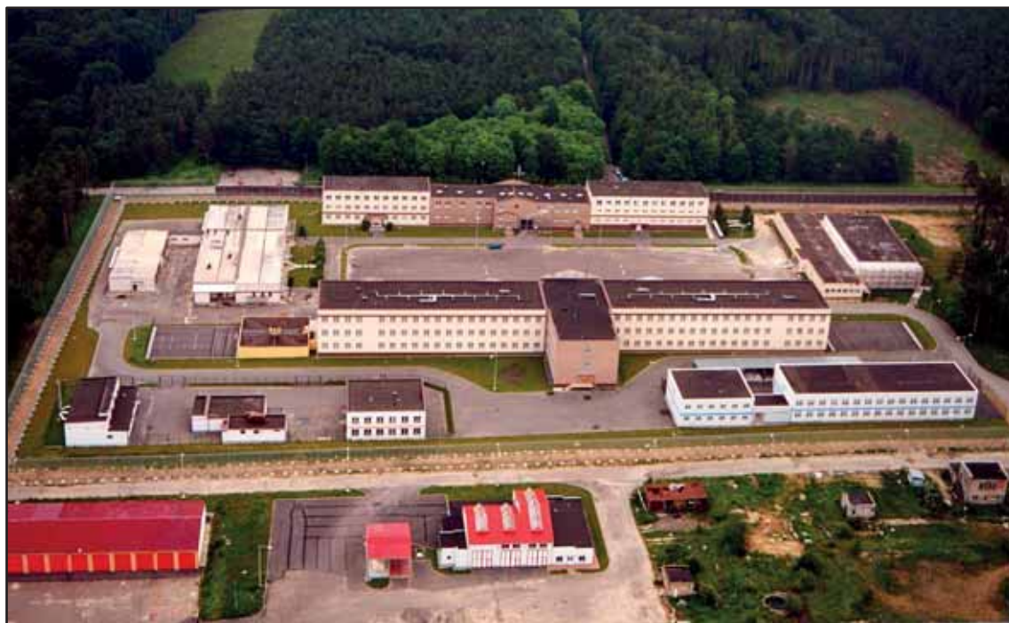
Věznice Jiřice