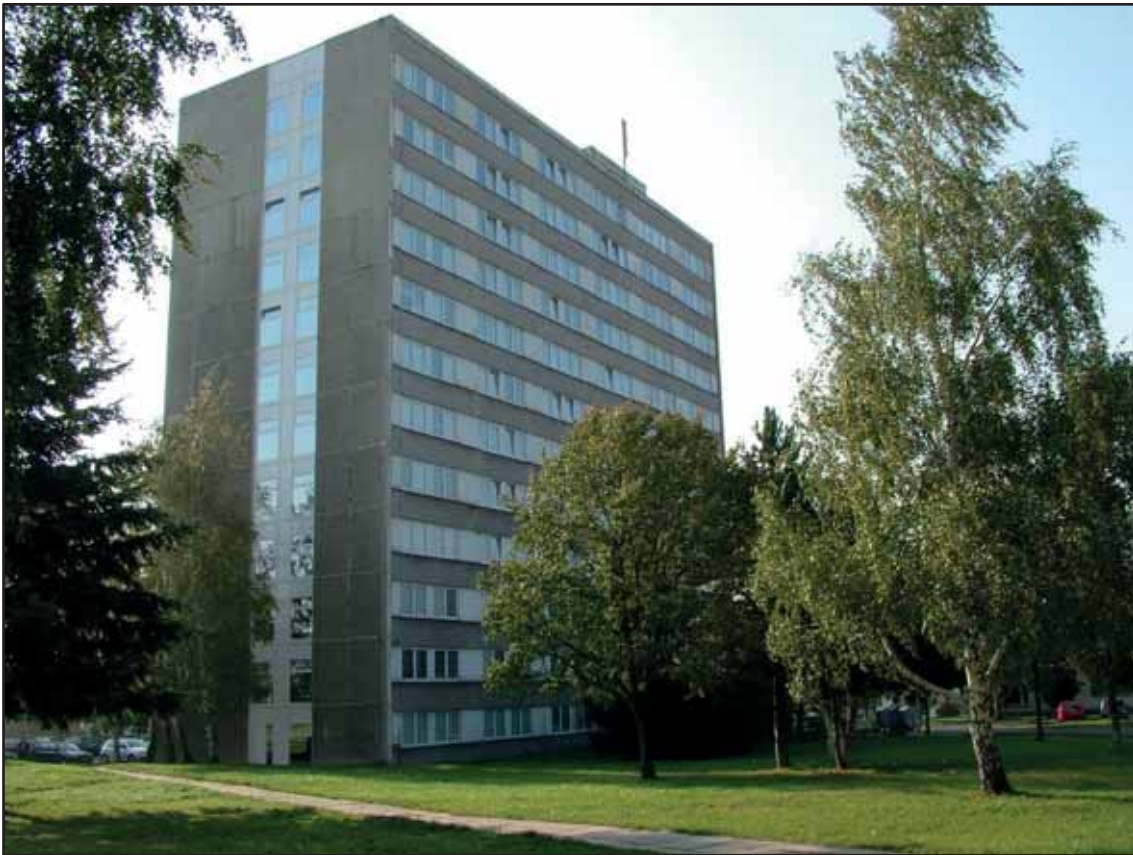
Původní školská budova IV VS ČR ve Stráži pod Ralskem

Justiční školy v Kroměříži. V letech 1998 až 2000 byl vybudován ve Stráži pod Ralskem nový školský areál IV VS. Organizační součástí IV VS se stal Kabinet dokumentace a historie VS ČR se sídlem v Praze.