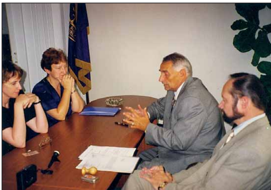
Podpis dohody s ČHV (1999)