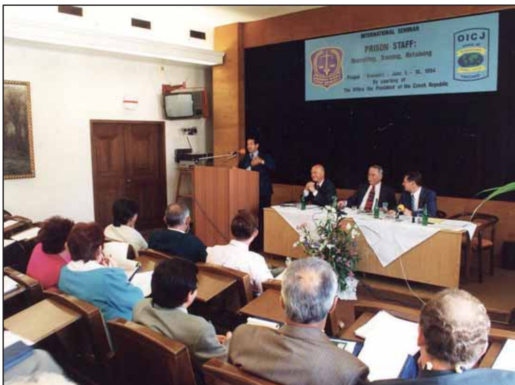
První zahraniční konference v Kroměříži (1994)