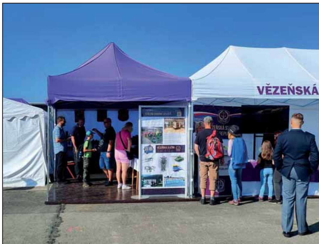
VS ČR na dnech NATO