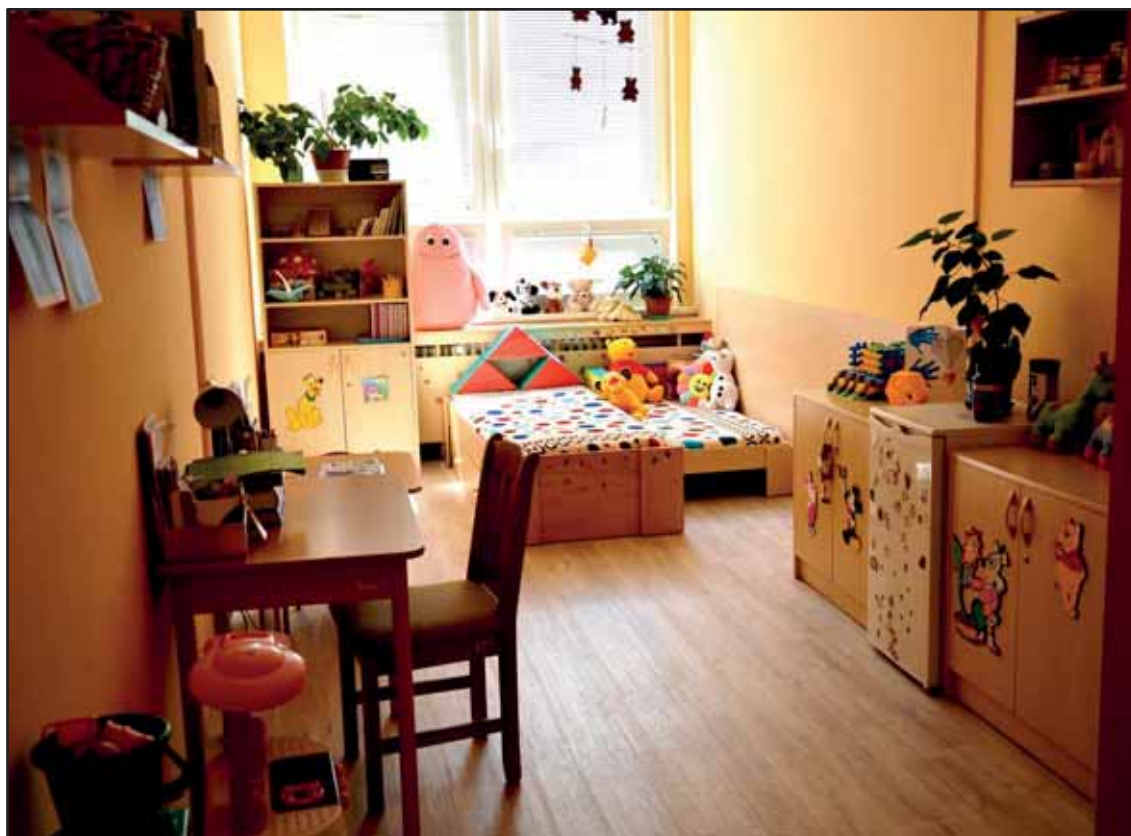
Dětský pokoj pro oddělení pro matky s dětmi ve Věznici Světlá nad Sázavou