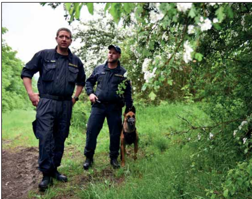
Příslušníci VS ČR na cvičení IZS v Bělušicích