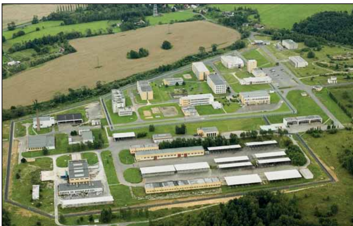
Věznice Kynšperk nad Ohří