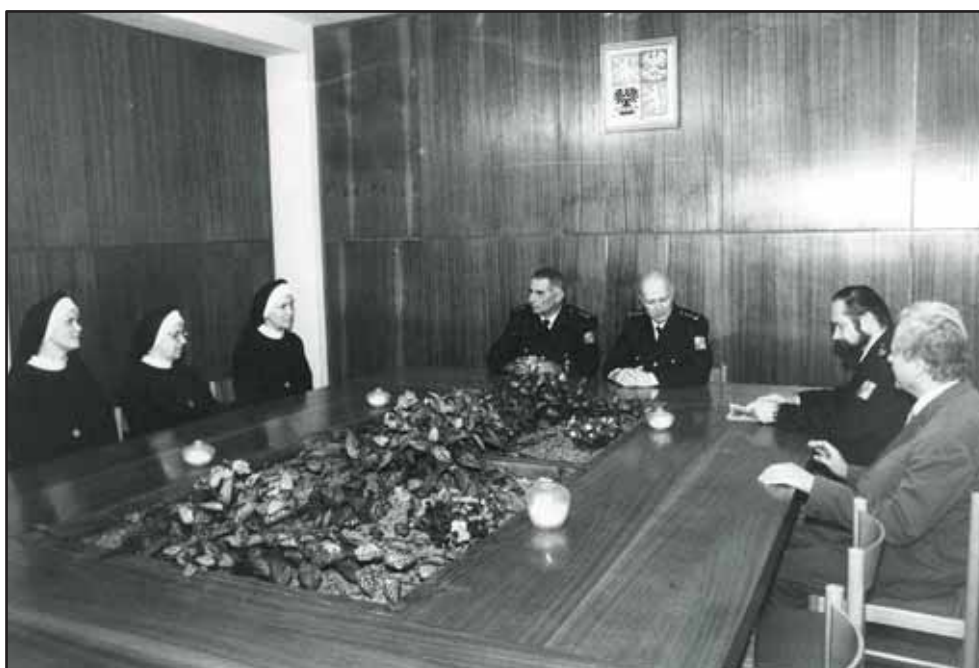
Jednání k uzavření smlouvy v projektu Praha Řepy