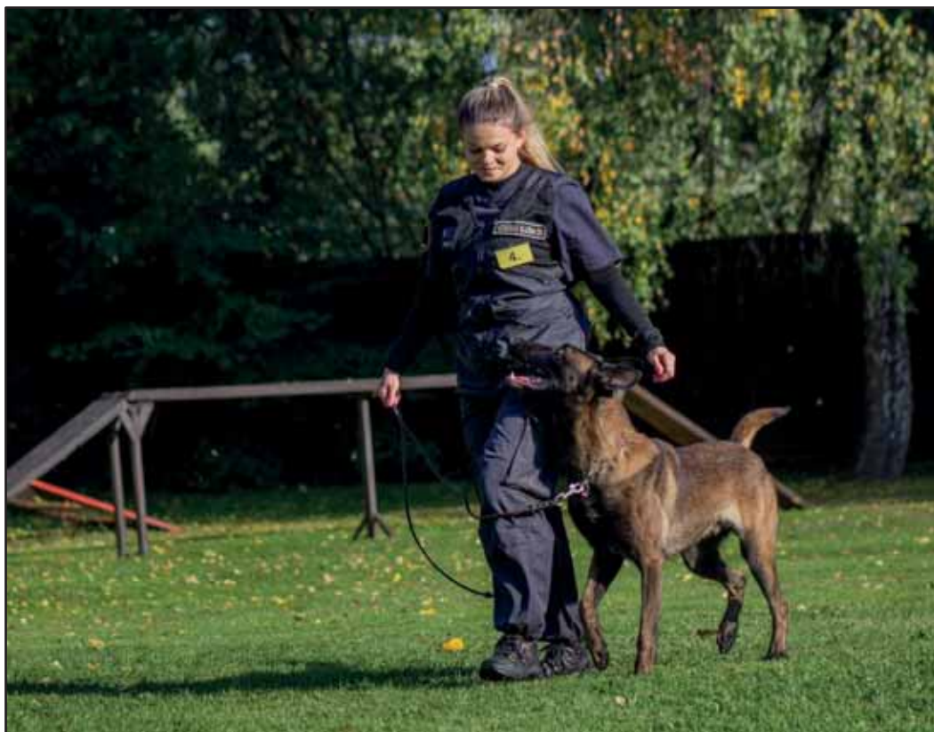
Kynologické přebory