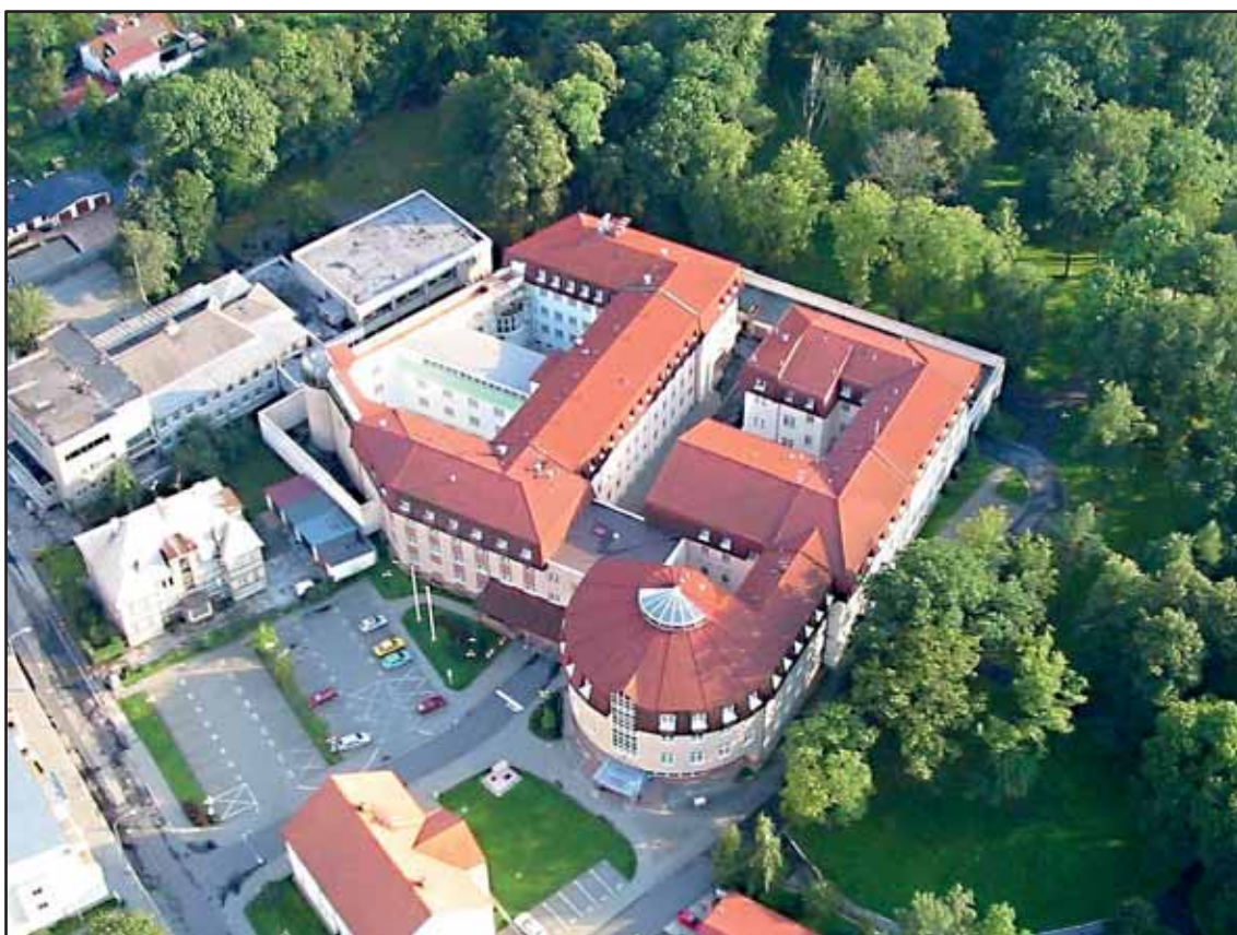
Věznice Karviná