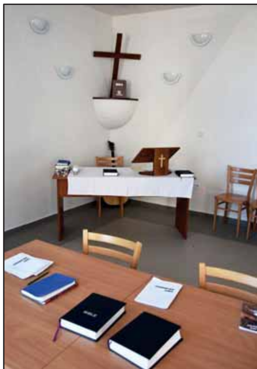
Kaple ve Věznici Odolov

zabezpečovací detence v Brně a Opavě. Na základě rozhodnutí soudu jsou v nich umístovány osoby nebezpečné, trpící duševní poruchou a odmítající soudně nařízenou léčbu. Vývoj počtu chovanců od roku 2009 ukázal, že je zcela nezbytné otevřít další detenční zařízení v Čechách s využitím dostupného specializovaného personálu a zdravotnických zařízení k externím odborným výkonům.