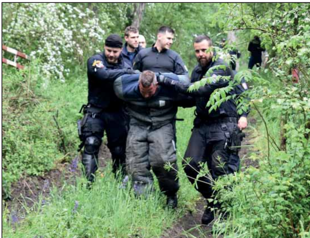
Příslušníci VS ČR na cvičení IZS v Bělušicích