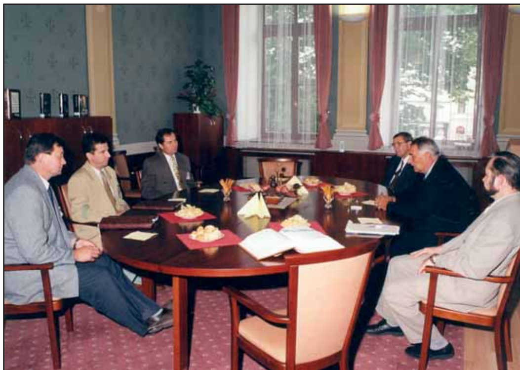
Jednání se slovenskou delegací na mezinárodním semináři v Kroměříži (1998)