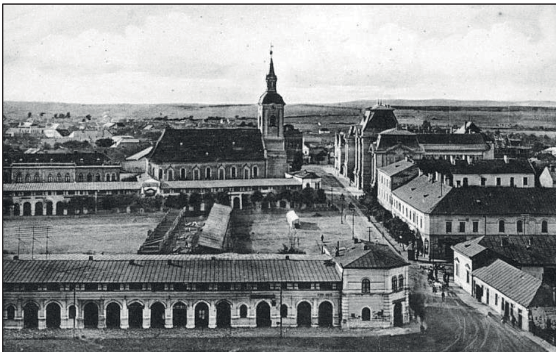
Berehovo – soudní budova vpravo naproti kostelu

dvorem, přičemž druhý z nich pro zeď vysokou 2,5 m nebyl považován za zcela bezpečný a užíval se jen pro malé skupinky vězňů konajících domácí práce. Vnitřní dvůr pak sloužil k procházkám. Část přízemních cel nemohla být používána kvůli nedostatečné bezpečnosti mříží umožňujících útěk. Obdobně chatrná však byla rovněž střecha. Absence vodovodu a kanalizace ve městě se samozřejmě týkala i věznice, jejíž žumpa pochopitelně nesnesitelně zapáchala a vývoz byl celkem nákladný. Asi nepřekvapí, že byla požadována stavební náprava zjištěných nedostatků a dodání potřebného vybavení na odvoz výkalů vlastními prostředky.