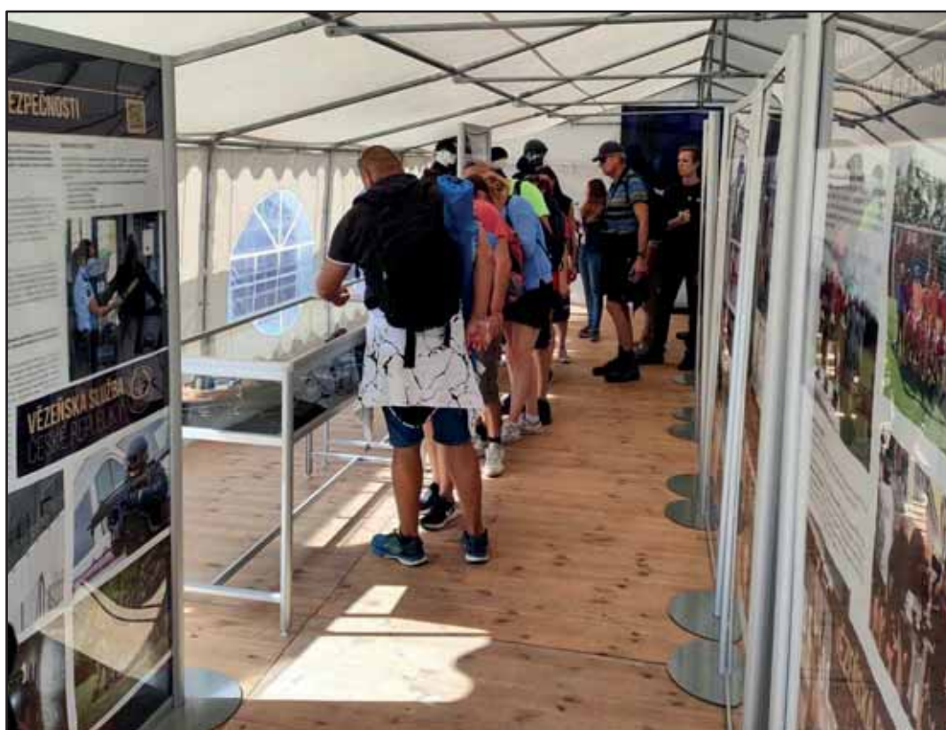
VS ČR na dnech NATO