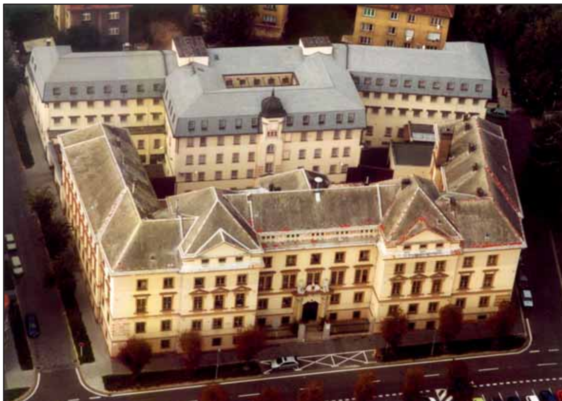
Věznice Teplice