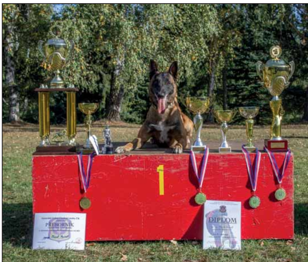
Kynologické přebory