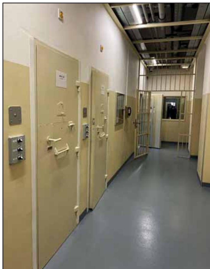
Vnitřní prostor Ústavu pro výkon zabezpečovací detence ve Vazební věznici Praha Pankrác